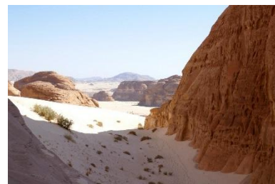
Grès et sable blanc