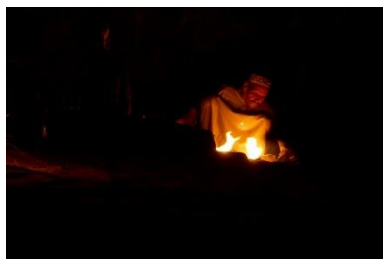
Ramadane, bédouin Muzeina

Il faut être à l'aise sur les chemins de pierres, parfois chaotiques, en montée et en descente. Le rythme de marche peut être cool, mais il faut quand même monter, et redescendre !