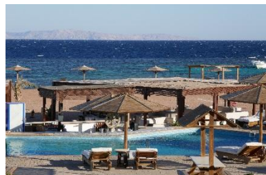
Et hop : une baignade en mer rouge !