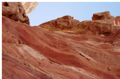
La magie colorée du désert du Sinaï