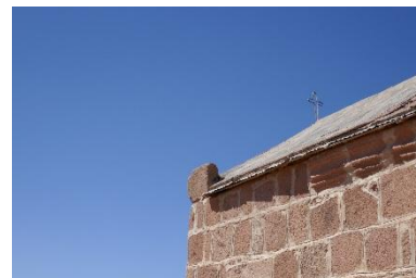
Chapelle au sommet du Mont Sinaï