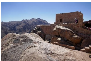
Mosquée au sommet du Mont Sinaï