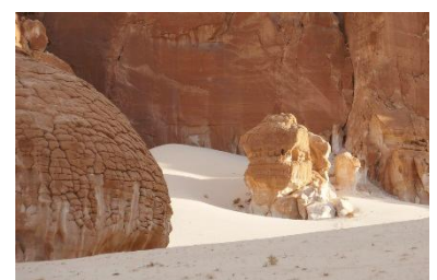
Grès et sable blanc