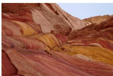
La magie colorée du désert du Sinaï