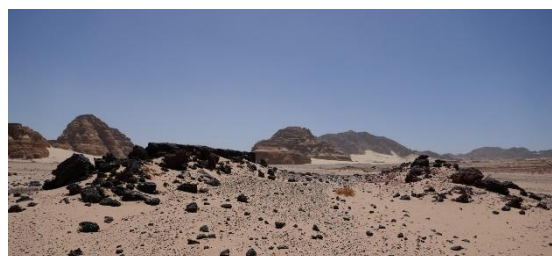
Des roches volcaniques ponctuent les plaines de sable