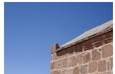
Chapelle au sommet du Mont Sinaï