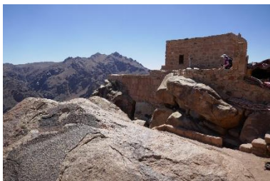
Mosquée au sommet du Mont Sinaï