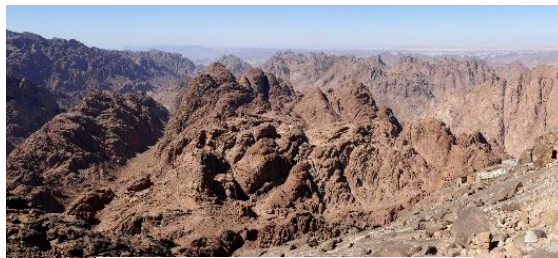
Vue du sommet du Mont Sinaï