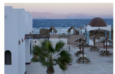
Et hop : une baignade en mer rouge !